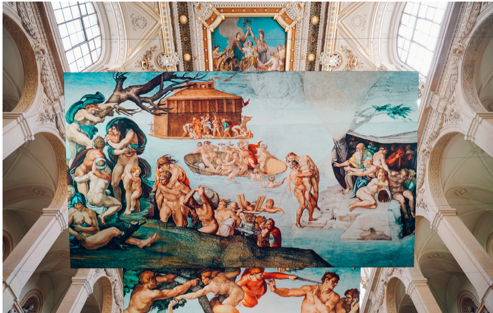
À découvrir à Lille du 9 novembre à début 2024. Fever

À partir du 9 novembre jusqu'au printemps 2024, Euratechnologies accueille une exposition incroyable de reproductions grandeur nature d'œuvres de Michel Ange de la chapelle Sixtine en Italie. Un événement unique.