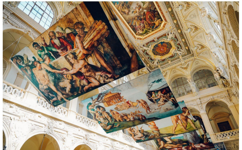
Découvrez 34 œuvres grandeur nature de la chapelle Sixtine dans l'atrium d'Euratechnologies. Fever

L'expérience sera enrichie de nombreuses anecdotes historiques et contextuelles, à découvrir via des fiches