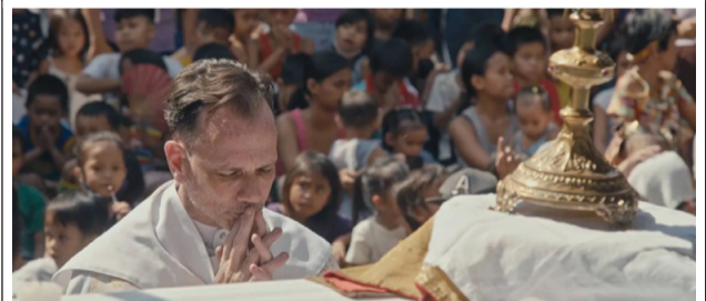
On suit le parcours de 5 prêtres dans le documentaire « Sacerdoce ».

Cinq prêtres, 5 destins, 5 engagements : le film documentaire Sacerdoce sort au cinéma. Il sera projeté au Kinépolis de Lomme les 20, 21 et 22 octobre à 17h45. La projection du dimanche 22 octobre sera suivie d'une table ronde animée par Madeleine Vatel, journaliste de RCF avec 2 prêtres nordistes et une chrétienne engagée :